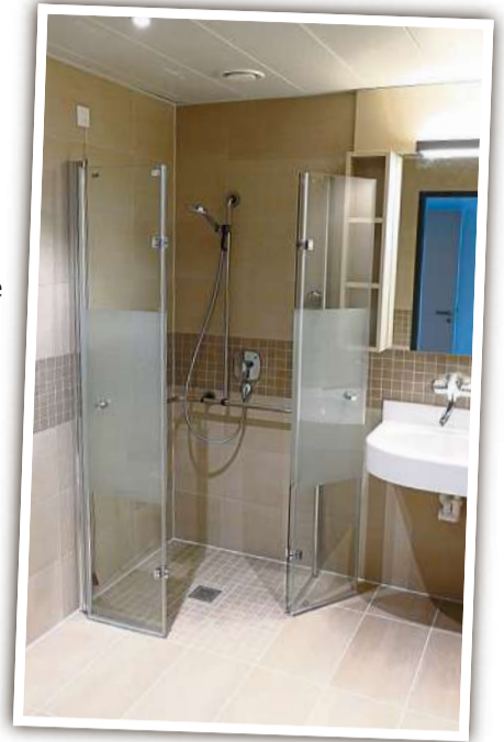
Bodengleiche Nasszelle in allen Patientenzimmern.